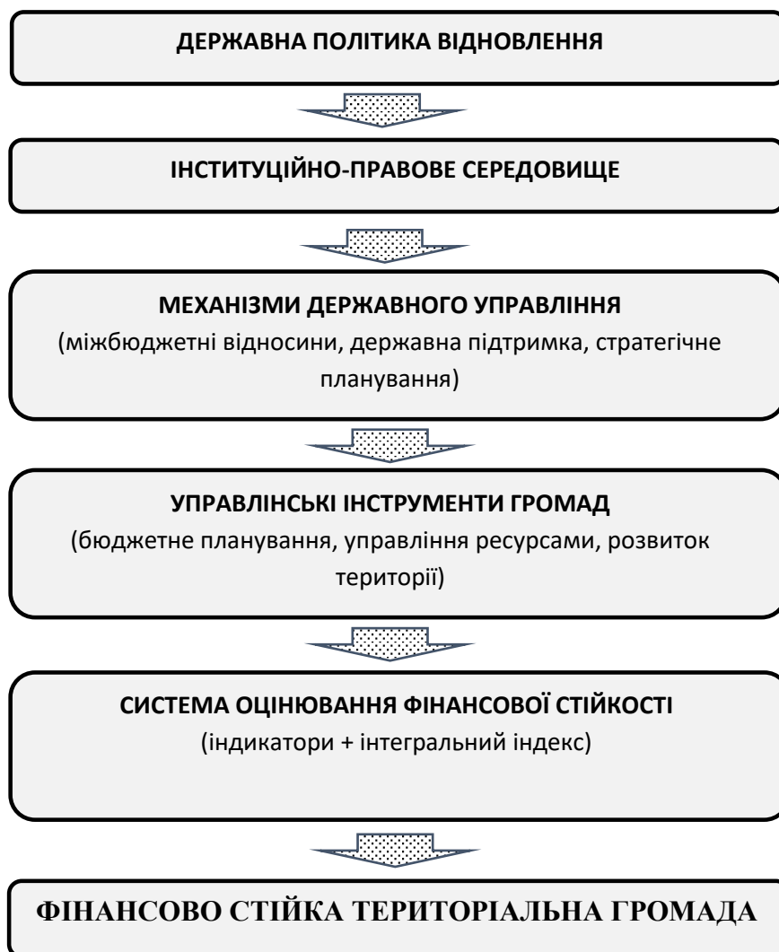
Рис. 4. Державна політика забезпечення фінансової стійкості територіальних громад

самоврядування, забезпечення збалансованості бюджетних процесів та підвищення спроможності територіальних громад до сталого розвитку і відновлення. Модель будується за принципом управлінської ієрархії реалізації державної політики, що передбачає послідовний взаємозв'язок між стратегічними цілями державної політики відновлення, інституційно-правовим середовищем її реалізації, механізмами державного управління, управлінськими інструментами органів місцевого самоврядування та системою оцінювання фінансової стійкості територіальних громад (рисунок 4).