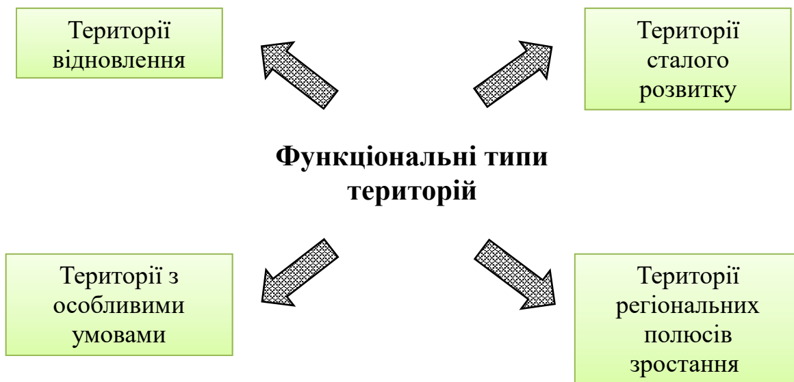
Рис. 2. Функціональні типи територій

застосовувати різні підходи до підтримки територіального розвитку залежно від особливостей територій. В умовах повоєнної відбудови та значних соціально-економічних трансформацій в Україні така класифікація дозволяє державі більш точно оцінювати потенціал, ризики та потреби окремих територій і застосовувати цільові інструменти державної підтримки. Фактично йдеться про перехід від універсального розподілу державних ресурсів до програмного підходу, за якого фінансові та інституційні інструменти розвитку адаптуються до специфіки конкретних типів територій. Відповідно до згаданої вище постанови Кабінету Міністрів України території поділяються на чотири основні функціональні типи (рисунок 2).