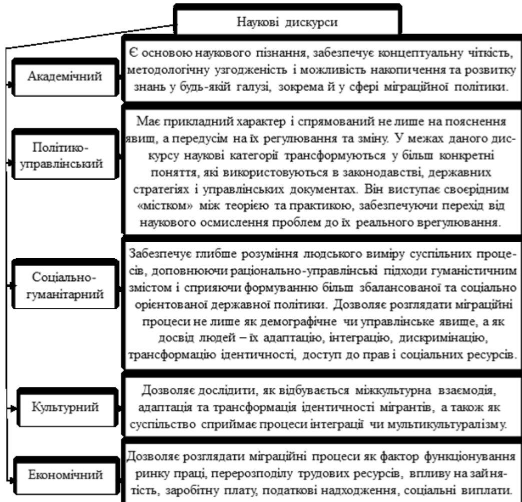
Рис. 1 Наукові дискурси

Пояснення змісту виокремлених дискурсів та розподіл наукових категорій за даними дискурсами показано відповідно на рис. 1 та 2.